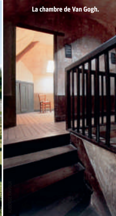
La chambre de Van Gogh.