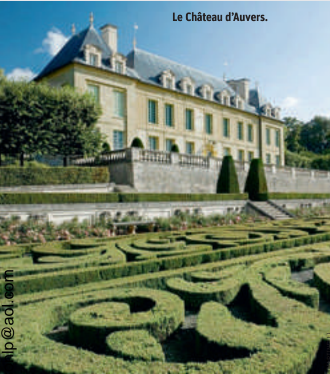
Le Château d'Auvers.