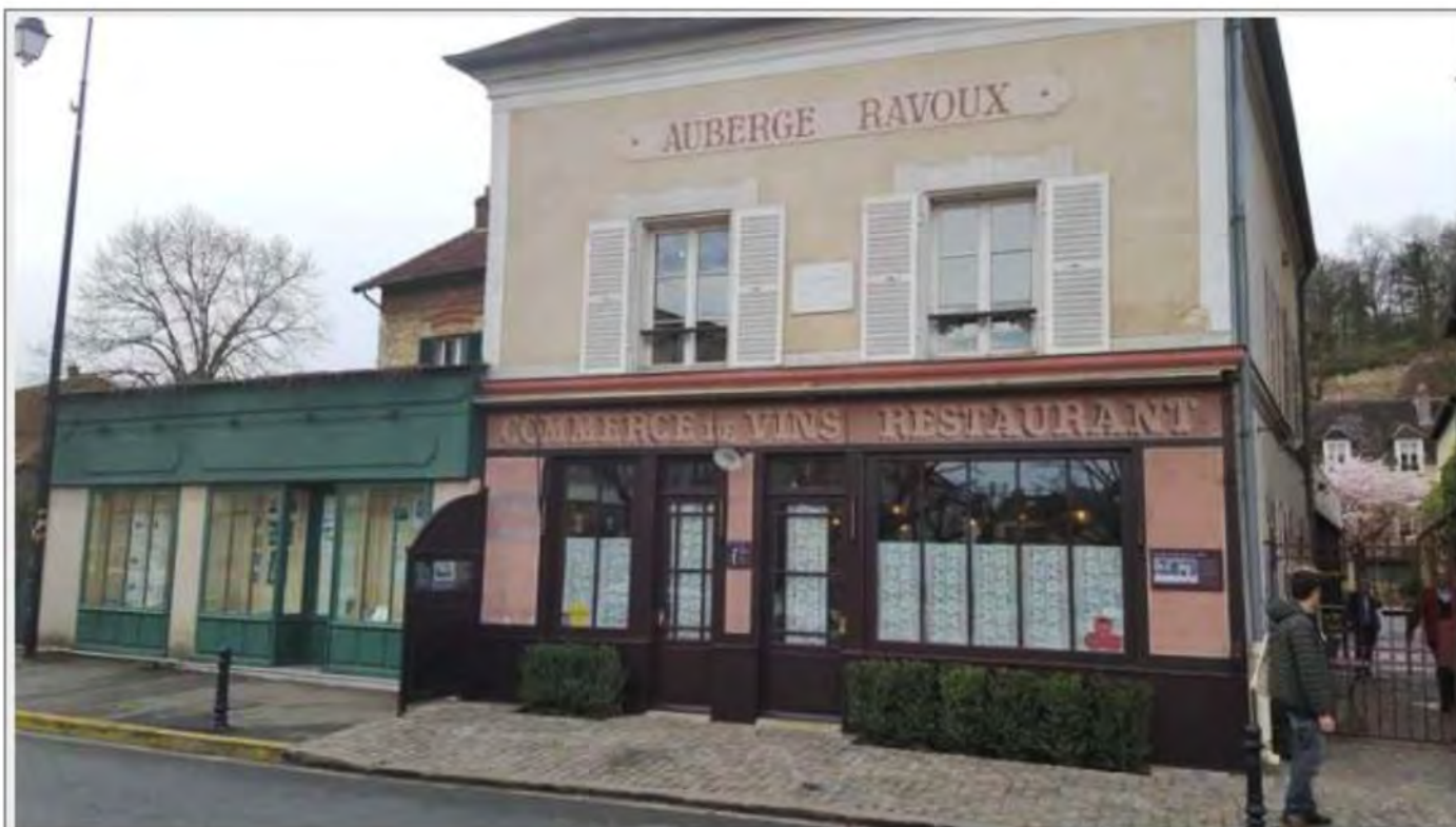
Auberge Ravoux sau "Casa lui Van Gogh", ultimul domiciliu al marelui pictor la Auvers-sur-Oise