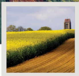
RÖRLIGA ÅKRAR. Målningen av de oändliga åkrarna hör till de mest kommenterade konstverken genom tiderna. © Målning: van Gogh.